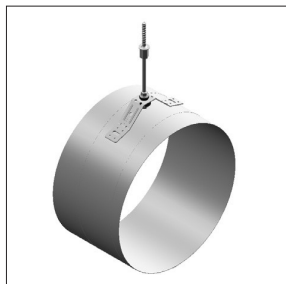
Soporte para conductos redondos insonorizado