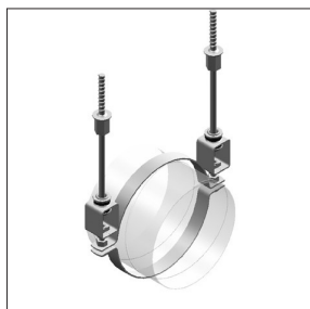
Abrazadera de ventilación con elemento de absorción de sonido DHL